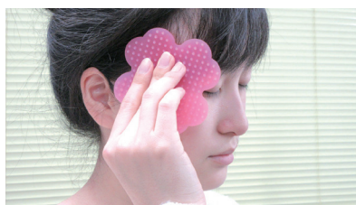
お顔・頭部へのマッサージ 身体全体にも適度な刺激を与えます