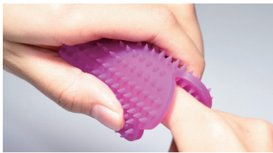
半分に折って指をはさみ 優しくゆっくりほぐしてください