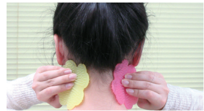
肩・首・ふくらはぎにあててゆっくり回す またはつまんでほぐしてください