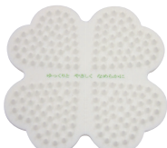
ほっぺのかたさの 白色

手のひらや指を使ってゆっくり、小さな動きで徐々に動かしていきます。それを代わってやってくれるのがこの「ナーシング クローバーZ」です。